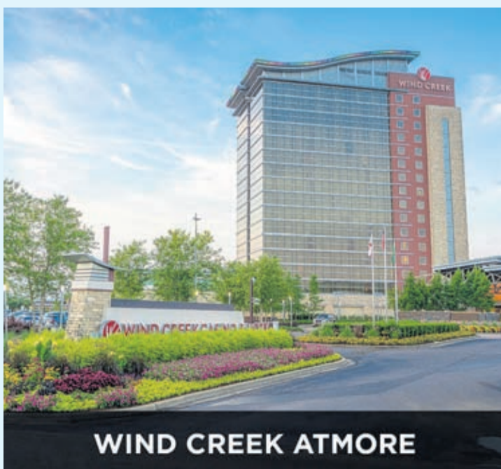
WIND CREEK ATMORE

Ayera nochi Wind Creek Casinos a anuncia 10 ganador cu a gana un trip pa Alabama. E campaña "Winning Through Wind Creek" a jega su gran final. Den luna di Juni e ganadornan lo bishita Wind Creek Atmore, Wind Creek Montgomery y Wind Creek Wetumpka, den un solo palabra un Wind Creek Tour na Alabama.